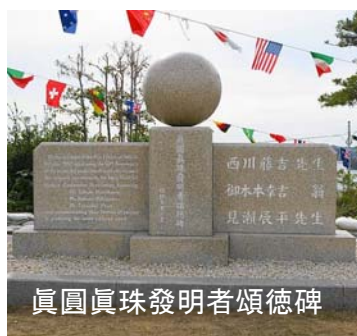
真圓真珠発明者頌徳碑

今では、記念碑には西川藤吉先生、御木本幸吉翁、見瀬辰平先生と、真円真珠の養殖技術を開発した三人の名前が刻まれ、中央に真珠をイメージした球型に削られた大理石が配置されています。