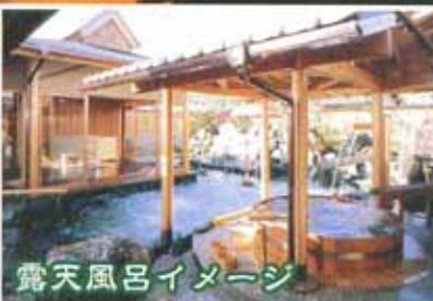
露天風呂イメージ